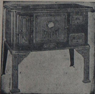
La cocina “ISTILART” Es la joya del hogar.

Avenida SAN MARTIN esquina VELEZ SANSFIELD U. T. 155 - F. VARELA