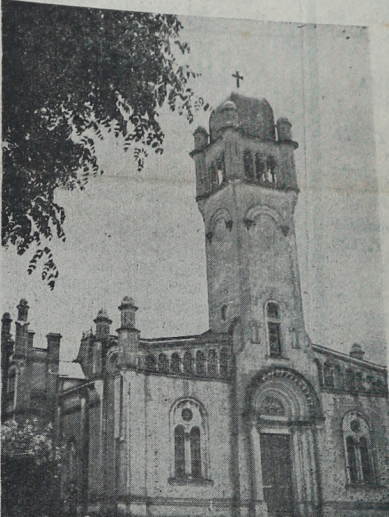
Parroquia San JUAN BAUTISTA, de cuyas obras de revoco y refacciones de ornato realizadas hace varios años, queda aun pendiente una deuda que oscila alrededor de cinco mil pesos.

ta, esa deuda se despeja totalmente a poco que observamos al labor proficua del Pároco doctor Vázquez, quien, en tan breve espacio de tiempo, se penetra de todos estos problemas locales, y siente inquietudes tendientes a lograr soluciones que nadie —con más obligación por