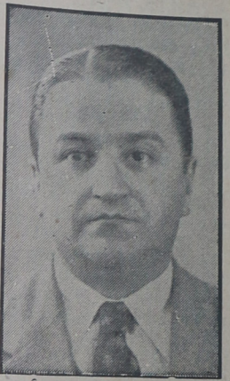
Candidato a Vice-Gobernador del radicalismo bonaerense