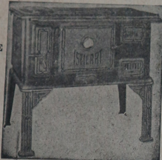
La cocina “ISTILART” Es la joya del hogar.

Avenida SAN MARTIN esquina VELEZ SANSFIELD U. T. 155 - F. VARELA