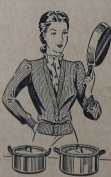
Con la COCINA ELECTRICA, obsequiamos magníficas pie- zas de batería, en aluminio, de la mejor calidad.