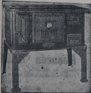
La cocina "ISTILART" Es la joya del hogar.

Avenida SAN MARTIN esquina VELEZ SANSFIELD U. T. 155 - F. VARELA