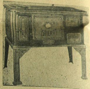
La cocina "ISTILART" Es la joya del hogar.

Avenida SAN MARTIN esquina VELEZ SANSFIELD U. T. 155 - F. VARELA