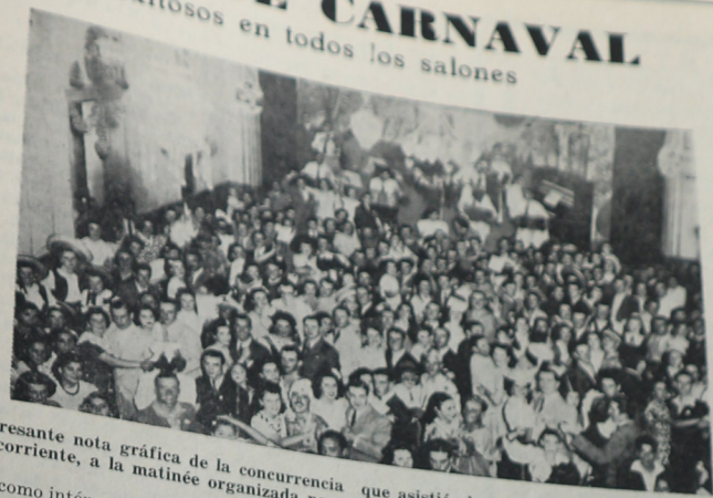
Interesante nota gráfica de la concurrencia que asistió al salón "La Patriótica", el domingo 22 del corriente, a la matinee organizada por el Centro Recreativo "Locos que se divierten"