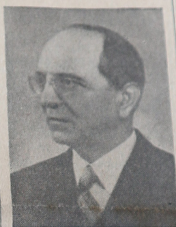
Doctor Rodolfo Moreno Primer término de la fórmula gubernativa que sostendrá el conservadorismo

Observando este estado previo al acto electoral desde nuestra posición intransigente de prensa, que no debe despojarse jamás de la responsabilidad que le incumbe en los juicios, no por temor a disposiciones gubernativas de oportunidad que ni siquiera tenemos en cuenta, sino, por la importancia que su trascendencia pudiera gravitar en el espíritu de las masas ciudadanas que concurrirán al comicio mañana, no tenemos ningún empacho en declarar que, mientras el pueblo asuma cualquier actitud en defensa de sus derechos, inalienables, por extrema que ella sea, estaremos íntegramente con él, pero, ante todo y por sobre todo, debe primar la cordura y el respeto recíproco en los distintos sectores de opinión que van a la lucha comicial.