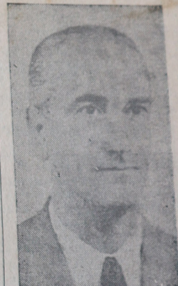
Dr. Carlos Sánchez Viamonte Representante de las fuerzas políticas de izquierda, que sostendrá el socialismo en el primer término de la fórmula.

Es indiscutible que el clima previo al acto comicial, ha preparado los espíritus ciudadanos en forma propicia para cualquier eventualidad. Negarlo, sería negar la claridad de la luz meridiana. Es un estado ambiente general en toda la provincia que ha contribuido a su aumento, la irregularidad y reciedumbre del acto comicial sanjuanino. Por otra parte, ni los oficialistas circunstanciales, ni los opositores —particularmente el radicalismo—, se han preocupado de dejar lugar a dudas, pues, los unos con sus procedimientos y los otros con sus prédicas, han