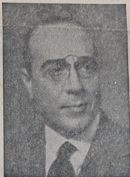
Doctor Obdulio F. Siri Candidato a Gobernador del radicalismo bonaerense

tendrá en sus manos el control del comicio y todos los resortes legales, que le aseguran la impunidad de los delitos electorales, enfrenará la lucha comicial en desigualdad de condiciones ante el adversario privilegiado.