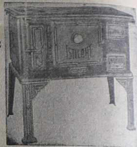
La cocina "ISTILART" Es la joya del hogar.

Avenida SAN MARTIN esquina VELEZ SANSFIELD U. T. 155 - F. VARELA